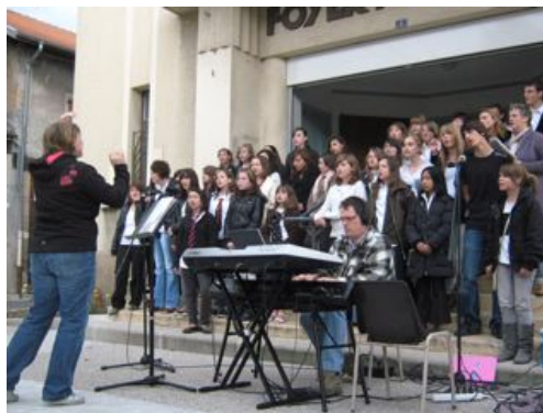
Faites de la musique avec le collégé !