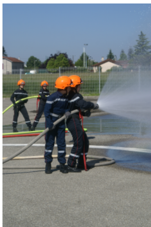
Le 5 juin, les JSP et les pompiers ont démontré leur talent : « Feu-noména ! » !

Ps: Lisez ce journal et vous serez grave affolés; parce que c'est nous qu'on l'a fait...! XD