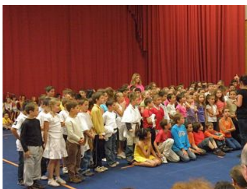
Un grand succès pour la fête des écoles publiques le 19 juin.

Informations Municipales n°125 juillet-août 2010